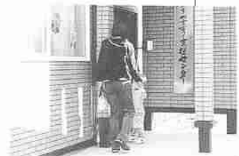
市民リポートは、市民のみなさんが自由に発想・企画するページです。

多いようです。家庭で、昼間子どもと二人きりで過ごされるお母さんには、ぜひこのセンターを利用していただきたいですね。相談ごとや問題がなければ行っただけなのか、と聞かれることもありますが、そんなことはありません。気軽に利用していただきたいですね」と同センターの活用方法などについて説明していただきました。 このセンターが、子育てを始められ