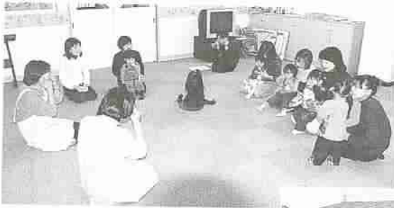
▲1、2歳児の親子を対象に、遊びを体験しながら親子の交流を深める『遊びの広場』（子育て支援センター）。