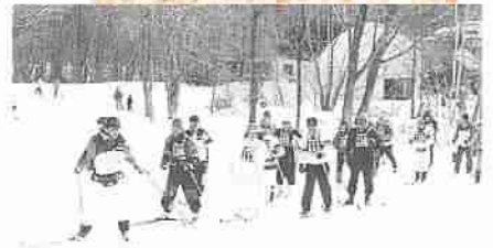
▲歩くスキーの集い