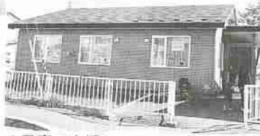
▲子育て支援センター