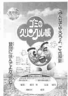
▲「ごみのクリンクル帳」で分別・排出方法を確認

※プラスチックのキャップは「燃やせるごみ」、金属のキャップや金属とプラスチックなどの混合キャップは「燃やせないごみ」として排出してください。 ③紙パックは、中をすすぎ、開いて乾かし、ひもなどで束ねて、公共施設や店舗などの回収ボックスに出しましょう。