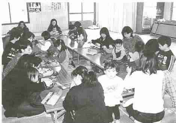
▲親子でクリスマス用のスタンドグラスを制作する子育てサークル『うんちず』のみなさん。

▼子育て支援センターでは、来園のほか、電話・ファクスによる『育児相談』を受け付けている。