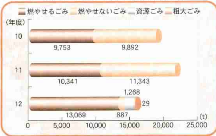
グラフ① ごみの量の推移（各年4月から12月末まで）

・排出ルールの守られていないごみが数多くごみステーションに出され、「収集できません」と書かれた警告シールを張られました。 その後、多くの方が率先してごみの正しい分別・排出ルールの順守に取り組みんでくれたことや、各町内会やクリーンリーダー、市の清掃指導員による指導もあって、警告シールを張られるごみは減少しました。 しかし、いまだにごみの分別・排出ルールを守らず、地域の方に迷惑をかけている人がいます。分別・排出ルールがまったく守られていないごみのごみステーションに出された場合は、清掃指導員が排出者を調べ、直接指導を