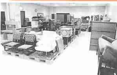
◀ クリンクルセンター内の再生品展示室。3月に展示品の無料抽選会を予定。

① ①ごみの資源化 各家庭や事業所から資源ごみとして排出された缶やびん、ペットボトルは、リサイクルプラザで選別・圧縮などを行い、有効資源としてリサイクルしています。平成12年1月から12月までに、資源ごみとして回収された缶やびん、ペットボトルなど約852tが資源としてリサイクルされました。(グラフ②) 生ごみを堆肥としてリサイクルする高速堆肥化処理施設では、登別温泉街