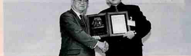
▲「鬼大使」の委嘱を受け、上野市長と握手するサンドウイさん