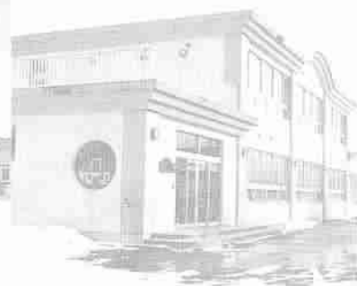
登別カトリック聖心幼稚園