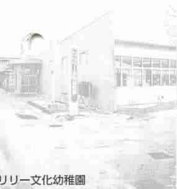
リリー文化幼稚園