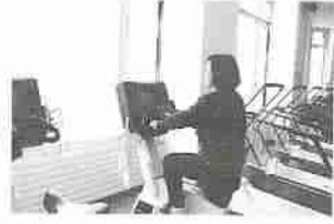
更年期を乗り切るため、積極的に体を動かそう

収を助ける働きがあり、更年期を迎え女性ホルモンが分泌が減ると、動脈硬化など血管の障害が起きやすくなるとともに、骨粗しょう症にかかりやすくなります。