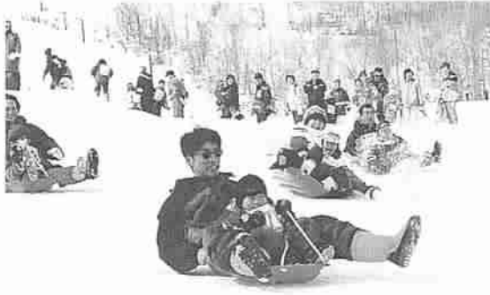
▲チューブレース大会

※催しによっては先着順で締め切るものがありますので、詳しくはお問い合わせください。また、都合により、時間や内容を変更することがありますので、ご了承ください。