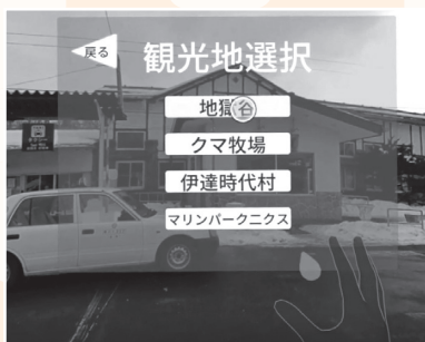
▲観光地を選択する様子