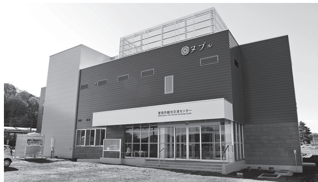
▲白老町側からの外観