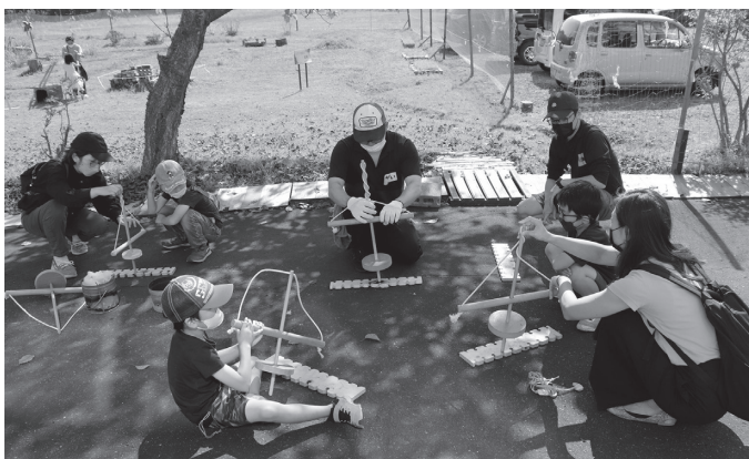
▲火起こし体験の様子

この訓練は、行方不明になった認知症高齢者などを地域の協力を得て早期に見つけ、保護することを目的に行ったもので、高齢者等SOSネットワークから配信された行方不明者の情報を基に協力機関や民生委員、児童委員などが声かけの訓練を行いました。訓練に参加した方からは、「声かけが難しかったけれども良い経験になった。そのときに備えたい」との声が聞かれました。