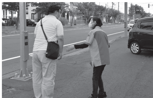
▲声かけの訓練を行う参加者