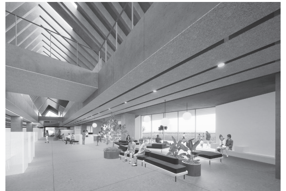
▲窓口と市民ホール