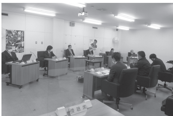
▲議会サポーターとの意見交換会の様子