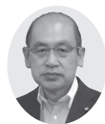
議員の 一般質問 中継はこちら