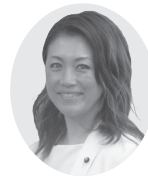
宮武議員の 一般質問 中継はこちら