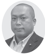
定立議員の一般質問 中継はこちら