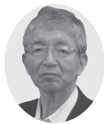
議員の 一般質問 中継はこちら