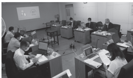
▲登別市社会福祉協議会との意見交換会の様子

処理の在り方などについて、引き続き委員会としても調査を進めていきます。 (宮武)