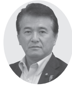
千田議員の 一般質問 中継はこちら