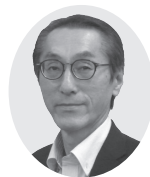
村井議員の 一般質問 中継はこちら