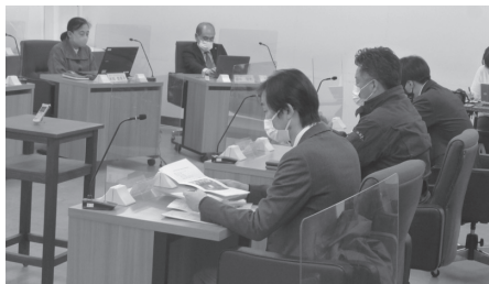
▲4月4日開催 議会サポーターとの意見交換会の様子

また、熊本県阿蘇郡小国町では、豊富な地熱資源を活用した取り組みについて、エネルギーの地産地消などを視察することとしています。