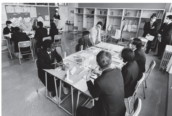
▲北海道登別青嶺高等学校の生徒と「健康なまちづくりに向けて」をテーマに意見交換しました。(6ページに掲載)