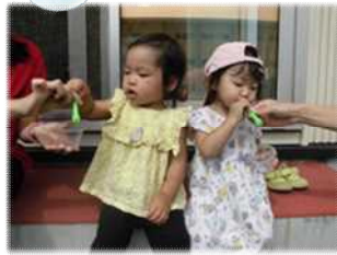
膨らんだほっぺたが可愛い♡