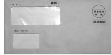
▲黄色の封筒で届きます

8月1日(日)以降の被保険者証は、7月中旬に世帯ごとに簡易書留で郵送しますので、配達時に不在の場合は、再配達の手続きをして、必ず被保険者証を受け取ってください。