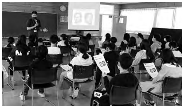
▲市の学芸員からの説明に耳を傾ける児童たち

縄文文化を学ぶ 縄文出前講座 6月8日、若草小学校の6年生の社会の授業で、『縄文出前講座』が行われました。『縄文出前講座』は、子どもたちに市内の遺跡から出土した土器や石器に触れてもらうことで、身近な歴史として感じてもらうよう開催しています。 児童たちは、現代の暮らしと比較しながら「縄文人はどんなものを食べていたのか」「縄文人にとって「貝塚」はどんな存在だったのか」などについて学び、講座の後半には本物の縄文土器や矢じりなどに触れ、縄文文化の暮らしに思いをはせていました。