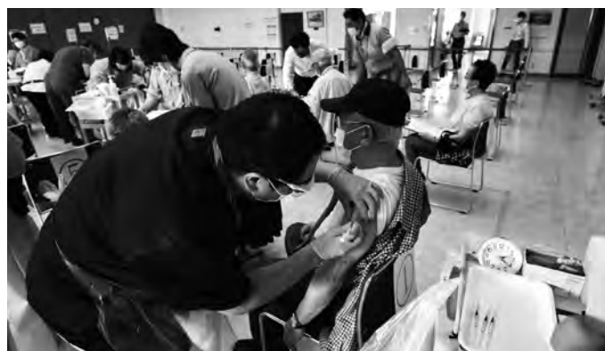
▲接種を受ける市民