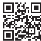
▲申し込みフォーム

申込方法 申し込みフォームまたは電話で新型コロナウイルスワクチン接種対策グループ