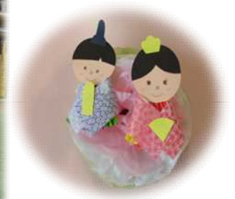
ぬりぬり・ぺたぺた じょうずじょうず◎