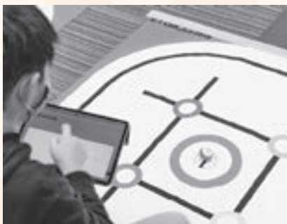
▲ゴールを目指して動くスフィロ