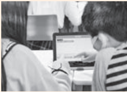
▲スフィロにプログラムを入力する幌別小学校の子どもたち

家電や自動車など、身近な物においても、ICT化が進む現在において、論理的な思考力を育む『プログラミング教育』の重要性が高まりつつあります。幌別小学校は、令和元年度から情報処理科を有する日本工学院北海道専門学校との優れた教育環境で、小学生向けのプログラミング教育を行っています。令和2年度は、3年生から6年生が、『スフィロ』というボール型のロボットとタブレット型のパソコンでプログラムの仕組みに触れました。