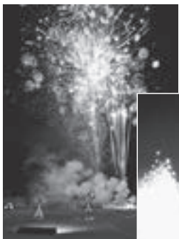
▶湯鬼神によって打ち上げられた鬼花火

今回は、例年6月から7月にかけて登別地獄谷で20時30分から開催している『地獄の谷の鬼花火』を子どもたちが参加しやすいよう、市内全中学校区で、開始時間を早めて開催。友だちと一緒にめぐったヨヨーすくいやトランポリン、キックターゲットなど、さまざまな団体によるブース。笛や太鼓の囃子に合わせて、2頭の熊が軽快に舞う登別温泉の郷土芸能『熊舞』。打ち上げ花火も加わった特別バージョンの鬼花火。感染症対策のため、家族や友だちとも距離を保ちながら見たことも、楽しい思い出の一つになったのではないだろうか。