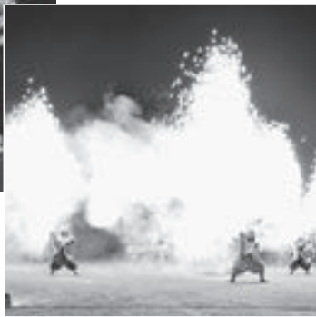
◀登別小学校グラウンドで披露された登別中学校生による『熊舞』