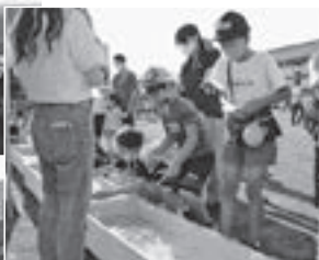
▲楽しむ子どもたち