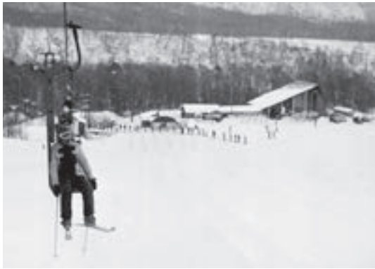
▲リフトに乗りコースを目指すスキー客 (昭和51年1月撮影)

カルルス温泉の近郊が、スキーの好適地として、盛んに紹介され始めたのは昭和7年頃。当時の新聞には、来馬岳など