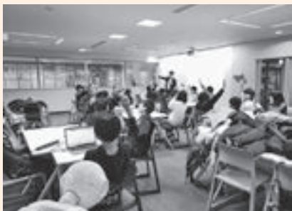
▲グループごとにたくさんの意見が出た話し合い

始めにプログラムの仕組みを学んだ児童たちは、グループに分かれてコンピューターを操作し、動作の組み合わせや順序をプログラミングしました。