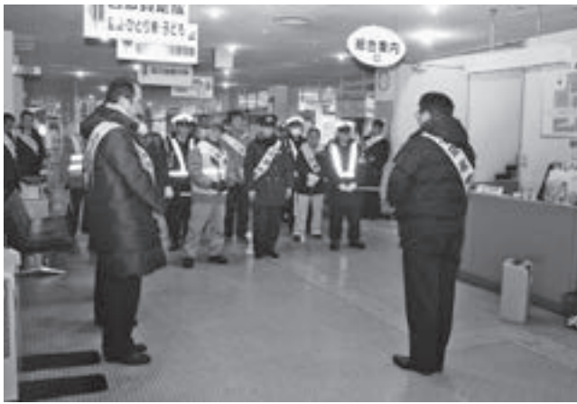
▲パトロールを前に気持ちを一つにする参加者たち