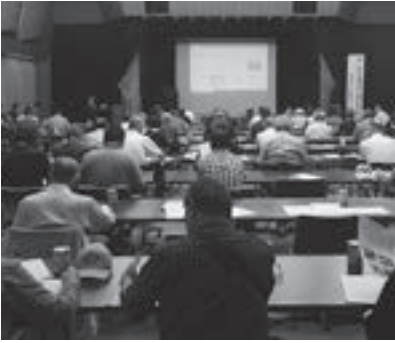
▲令和元年9月17日(火)に行い、約100人が参加した自主防災組織防災研修会

域は自分たちで守る』という『共助』の意識のもと、町内会や自治会など、地域の皆さんが自主的に防災活動を行っている団体です。