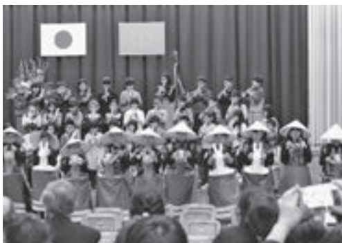
▲地域のみなさんとともに練習を重ねた『幌別駒おどり』を披露する児童たち