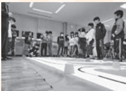
▲試行錯誤を経て完成させたロボットを操作する児童

日時 ・1月18日(土)11時～14時30分 ・1月26日(日)10時～14時30分