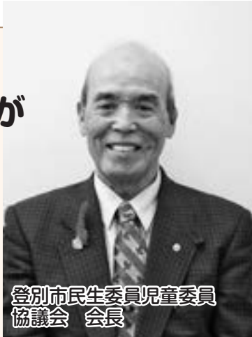
登別市民生委員児童委員協議会 会長

○育児・教育 ・赤ちゃんが産まれるまでに何かしておくことはあるのだろうか ・しつけに自信がない ・子どもが、学校に行きたがらない ○年金・保険 ・年金に関して必要な手続きはあるのだろうか ・自分が加入できる健康保険は、どんなものがあるのだろうか ○生活 ・環境が急変して、生活が苦しい ・一人暮らしで何かあったら心配だ ・詐欺被害にあっているかもしれない