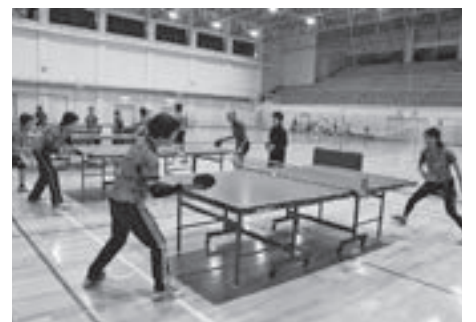
▲軽快にラリーを繰り広げるメンバー