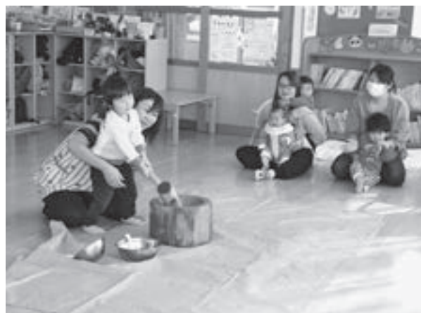
▲先生に手伝ってもらいながら、一生懸命餅をつく子ども