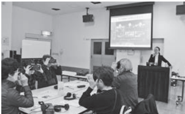
▲VR装置をつけて、映像を見る参加者