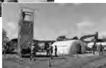
▶平成29年9月、登別中学校を主会場に行った総合防災訓練