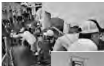
◀平成25年7月、富岸小学校を主会場に行った総合防災訓練