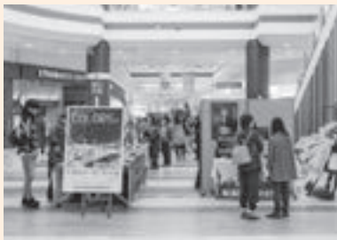
▲イオンモール苫小牧で開催予定の『卒業・修了展』(写真は昨年の様子)