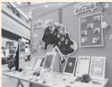
▲キャラクターのイラストやデザイン、衣装など幅広い作品を展示

品も多くあります。子どもから 大人まで楽しめる展示会となっ ていますので、皆さんの来場を お待ちしております。