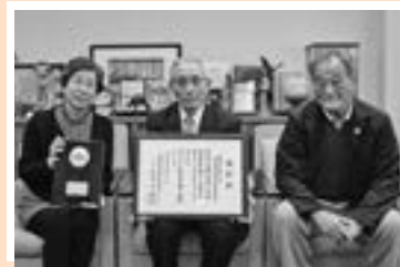
▲地域の交流やつながりを深める活動を続ける協議会のメンバー

これらの功績が認められ、平成30年9月に全国民生委員児童委員連合会から『優良民生委員児童委員協議会表彰』を受賞しました。