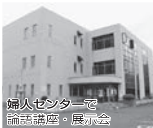
婦人センターで 論語講座・展示会