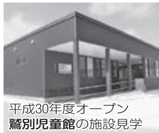
平成30年度オープン 鷺別児童館の施設見学