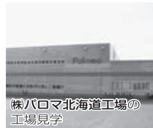
(株)パロマ北海道工場の 工場見学