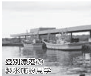
登別漁港の 製氷施設見学