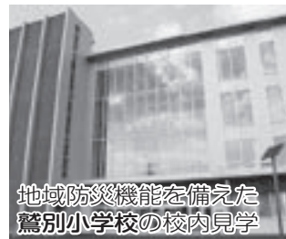
地域防災機能を備えた 鷺別小学校の校内見学