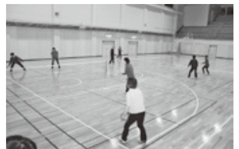
▲体育館にこだまするメンバーの笑い声

「ダブルスでゲーム形式の練習を繰り返して行っています。スポンジテニスの腕前は、同じくらいの人が多いですね。ゲームの勝ち負けにこだわらず、お互