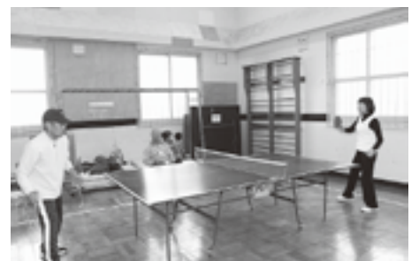
▲休憩をはさみながら和やかに卓球を楽しむ会員

「卓球台は複数ありますが、現在の人数では交代で休憩しながら1台で行うのがちょうどいいですね。会員同士の仲が良く、休憩中の雑談もサークル活動の