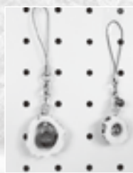
▲シカ角ストラップ