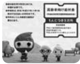
▲臨時的な措置として給付された臨時福祉給付金