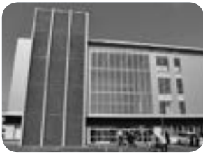
▲新しくなった鷺別小学校

支出のポイント 『民生費』は、年金生活者等支援臨時福祉給付金給付事業の実施などにより、前年度に比べ3.6億円（5.3割）の増となりました。 『教育費』は、鷺別小学校建替事業の実施などにより、前年度に比べ7.8億円（51・8割）の増となりました。