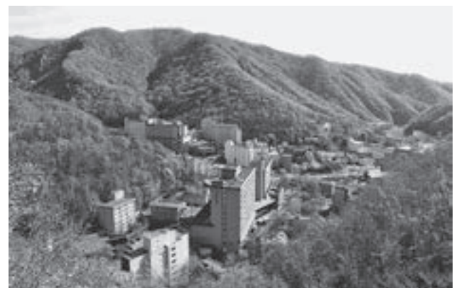
▲市民や観光客が安心して宿泊できる安全な観光地として、ホテルの耐震化を進めている登別温泉地区