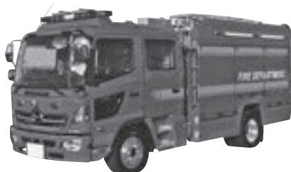
▲2月末に配備される水槽付消防ポンプ自動車の同型車