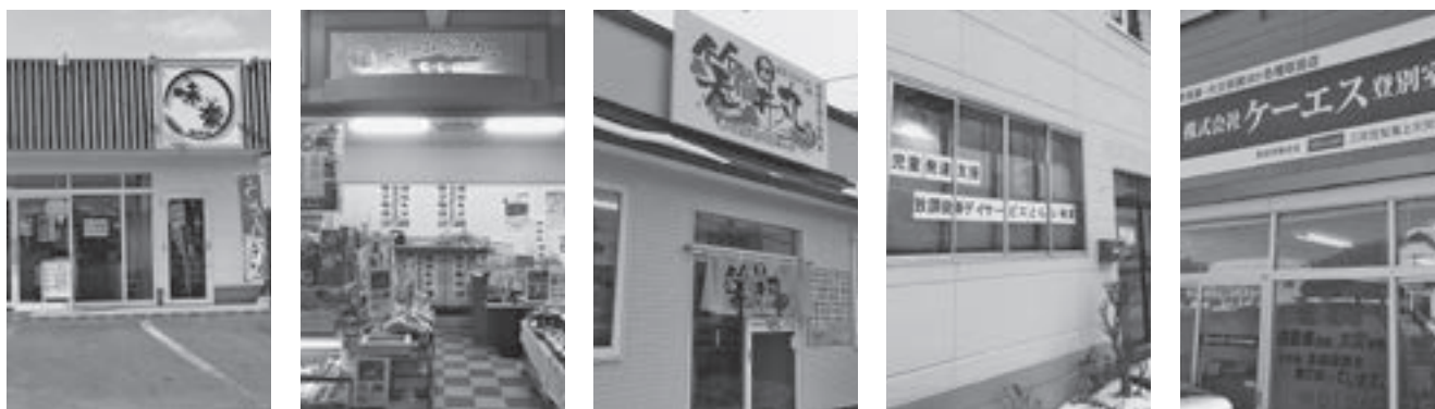
▲事業所開設費補助金を利用して開業した店舗