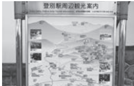
▲観光客の利便性向上を図るため修繕・整備を予定している観光案内看板の一例

登別温泉からJR登別駅にかけて、多数の観光案内看板や市内地図などが設置されていますが、多言語表記の不足や老朽化などが進んでいることから、観光客の利便性向上を図るため、観光案内看板の外国語表記の統一のほか、老朽化が進行した箇所の修繕・整備を行います。