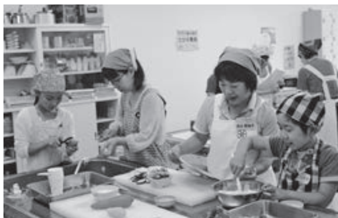
▲食生活改善推進員や市の栄養士の指導のもと、親子で楽しく調理をする参加者