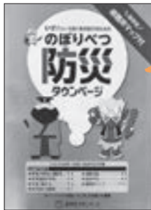
▲7月上旬に『市民便利帳』と『電各話帳』の合冊版(右)とも『のぼりべつ防災タウンページ』の別冊版(左)を家庭に配布された。