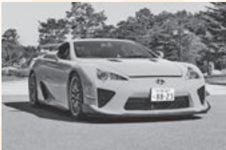
▲レクサスLFA ニュールブルクリンクパッケージ

9月の体験入学 日時 ・9月10日(土)・24日(土) 10時30分～14時30分 ・9月17日(土)・18日(日) 9時30分～14時30分 問い合わせ 入学広報室 (☎0120-666-965)