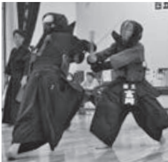
▲竹刀を振るい、気合の声を響かせ白熱した戦いを見せる児童たち