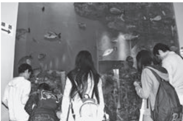
▲登別マリンパークニクスで魚の観賞を楽しむ熊本の子どもたち