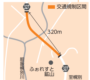
▲交通規制のお知らせ