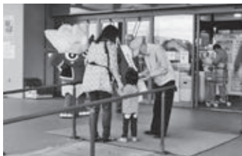
▶ 昨年の街頭啓発活動

今年度の事業は、市内小学校に市民憲章唱和の依頼と合わせて、小学4年生を対象に市民憲章文を記載したクリアファイルを配布し、市民憲章啓発標語コンクールを行いました。 なお、優秀作品については、今後、広報のほりべつなどでお知らせします。 また、9月20日(火)に大型スーパ―など市内3カ所で、通学や買い物中の方に街頭啓発を行い、市民憲章文を