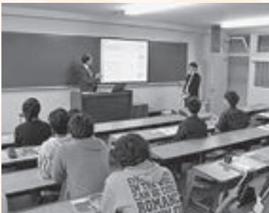
▲編入学入試説明会の様子