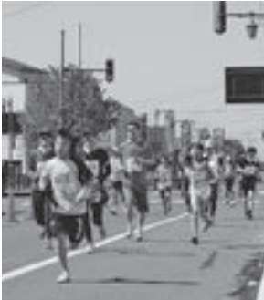
▲春の風を感じながら市街地を駆け抜けるランナー