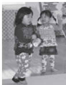
▲こいのぼり型のけん玉を持って元気に遊ぶ子どもたち

4月27日(水)、登別子育て支援センターで『お楽しみデー』（同センター主催）を開催しました。