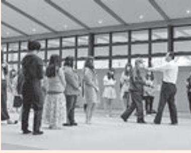
▲護身術を学ぶ女子学生

本校では、毎年数人が室蘭工業大学3年次へ編入しており、そのサポートを強化するため、今年度から情報処理科大学編入コースを設置しています。