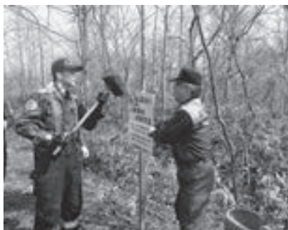
▲山菜採りでの遭難防止啓発看板の設置の様子

この日は、上登別町とカルルス町を結ぶ道道洞爺湖登別線沿いで設置作業が行われました。