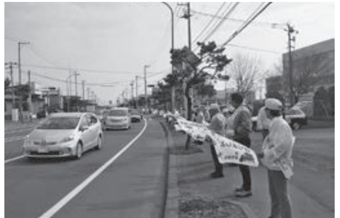
▲沿道で交通安全を呼び掛ける関係者