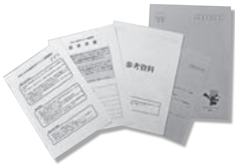
▲まちづくり意識調査の同封物