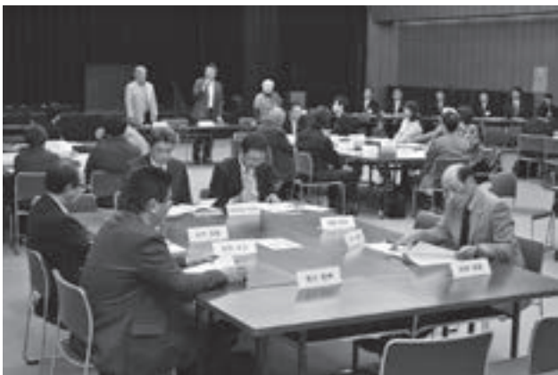
▲協働のまちづくりを推進するために組織された市民自治推進委員会