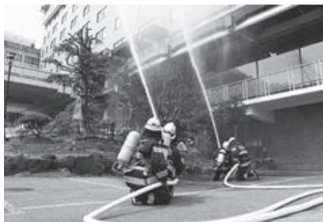
▲連携を図り、手際よく放水作業を行う消防職団員