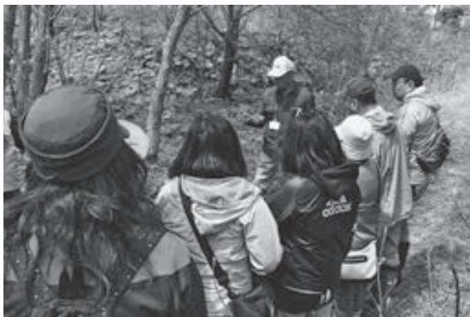
▲保全エリア内の植物の説明を聞く参加者

春の湿原を散策 ミズバシヨウ観察会 キウシト湿原は、昨年4月に一般公開を開始し、さまざまな観察会が実施されています。5月には、3日(火)から5日(木)にかけて『ミズバシヨウ観察会』（『NPO法人キウシト湿原・登別』主催）が行われました。 最終日の5日(木)には、約20人が参加。同法人会員の案内で、通常は立ち入ることのできない『保全エリア』の中を散策しました。 観察会開始時は曇り空だったものの途中からは天気にも恵まれ、参加者は約1時間30分かけて、ミズバシヨウや貴重な在来植物などの観察を楽しみました。