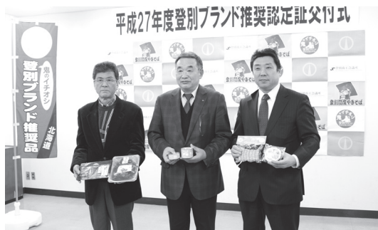
▲新たに『登別ブランド推奨品』に認定された自社の商品を手にする事業者