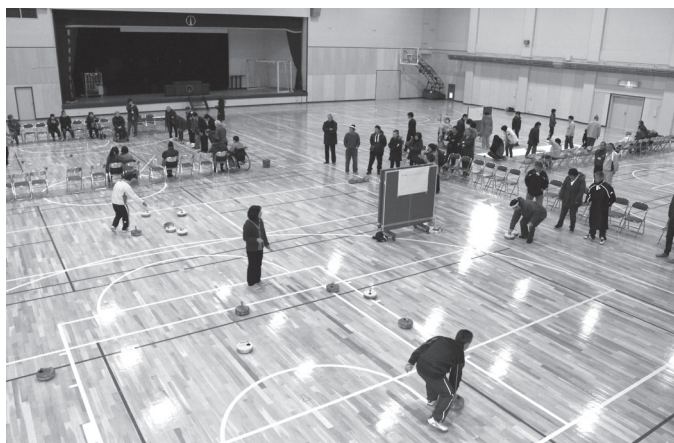
▲床の研磨や壁の塗装など、さまざまな工事が行われたアリーナでスポーツを楽しむ参加者