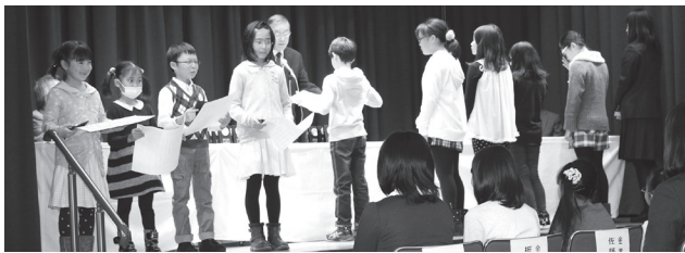
▲表彰を受ける受賞者