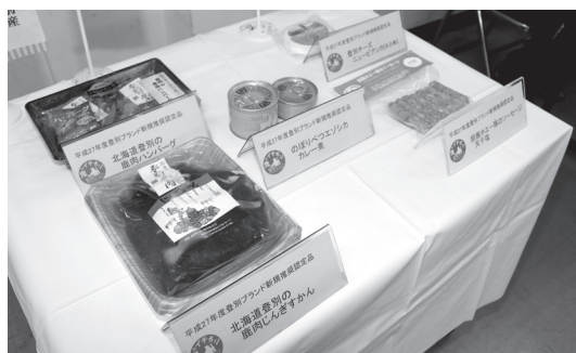
▲今回『登別ブランド推奨品』に認定された、地元産一次産品などを活用した自慢の商品