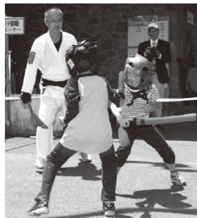
▲思いぎりチャンバラを楽しむ