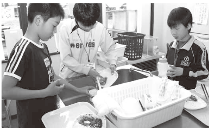
▲協力して食器を洗う子どもたち