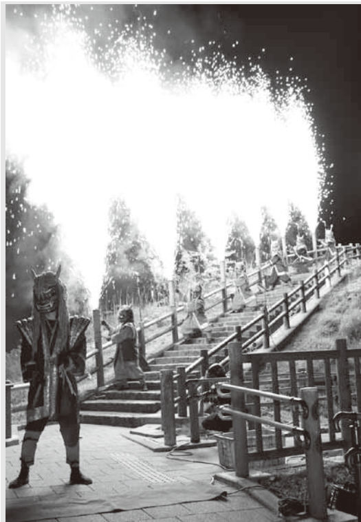
▲地獄谷の夜空を彩った鬼花火

『地獄の谷の鬼花火』は、8月7日(金)までの毎週木・金曜日の20時30分から、地獄谷遊歩道を照らす『鬼火の路、幻想と神秘の谷』は、日没から21時30分まで通年開催しています。