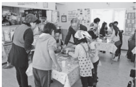
▲地域の方と一緒に、思い出に残る調理体験

幌別東小学校区放課後子ども教室『はまなすメート』は、学校の授業のほかに幅広い教育を行うことを目的に、平成23年10月に開設されました。 町内会の会員などがコーディネーターとなり、毎週火曜日と木曜日の放課後に空き教室を利用して、子どもが学校の授業の予習・復習をするのを親身に手伝うほか、一緒に工作や昔の遊びを楽しみ、体育館で球技やなわとびを通じた体力づくりなどを行っています。