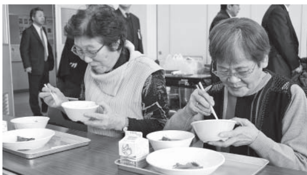
▲給食を食べ、思わず笑顔がこぼれる参加者

鬼や福の神の衣装をまとった『元鬼ふりまき隊(豆まき隊)』が、各会場で太鼓や鐘、笛などを鳴らしながら、無病息災・家内安全・商売繁盛を祈願。保育所では、鬼の登場に驚き、泣きだす子どももいる中、『福はく内、福はく内』との掛け声とともに、元鬼ふりまき隊へ向かい元気に豆をまく子どもの姿が見られました。