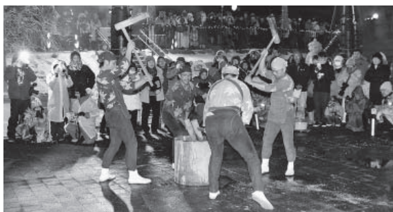
▲泉源公園で行われた子宝もちつき舞