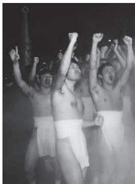
▲勝利を喜び合う紅組

4日の夜には、泉源公園で『源泉湯かけ合戦』が行われ、氷点下10度の寒さの中、紅白に分かれた下帯姿の若者約100人が、勇壮に湯をかけ合いました。紅組が勝つと湯の温度が上がり、白組が勝つと湯量が増えると言われており、こじは紅組が勝利を飾りました。