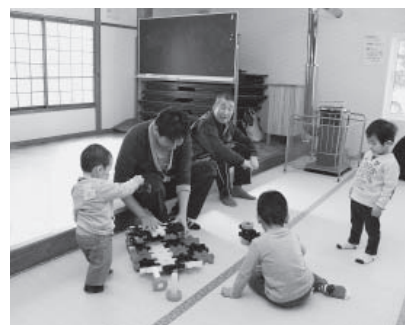
▲お父さんにも子どもが集まる