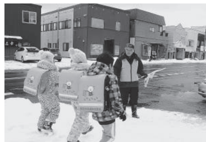
▲ 子どもも元気にあいさつをする

幌別小学校区の町内会では、子どもを交通事故から守り、不審者の出没を防止するため、校区の町内会会員の方が、子どもの登下校時に交差点で子どもを見守るとともに、下校時には子どもの下校に付き添うなどしています。