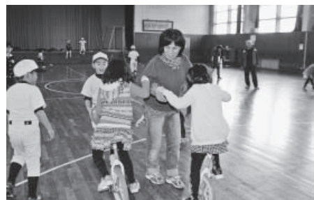
▲寒い季節も元気いっぱい遊ぶ子どもたち

鷲別地区放課後子ども教室『ひなわしメート』は、子どもが安全・安心に遊べる環境が求められる中、放課後の子どもの居場所を確保し、社会全体で子どもを育てるために、平成22年6月に開設されました。 毎週水曜日と金曜日が開放日となっており、約120人の子どもが楽しく通っています。毎回、子どもたちは、地域の方が担