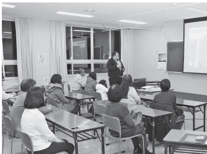
▲講師の日本での苦勞話を熱心に聴く参加者