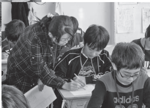
▶分からないところは、納得するまで優しく説明