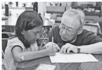
▲子どもの疑問に丁寧に答える

登別本町2町会は、町内の商店の店舗跡を活用した『ふれあいサロン花園』で、住民による子どもの学習支援として、市が用意した学年別の問題集を教材に使い、『夏休み・冬休み子ども塾』を開催しています。