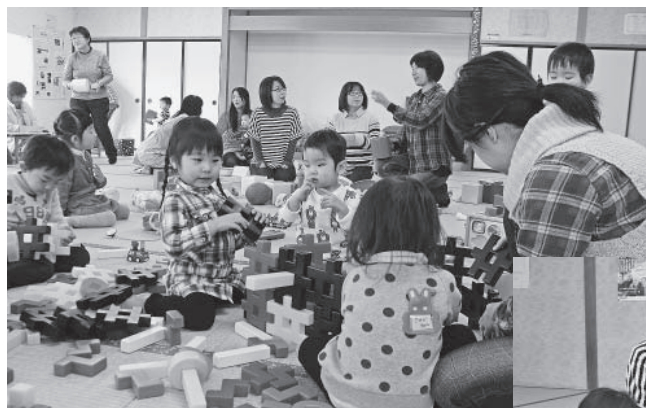
◀安全に配慮された会場で思い切り遊ぶ子どもたち