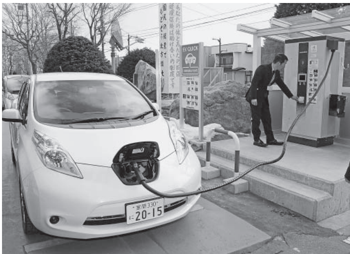
▲急速充電器で充電中の電気自動車