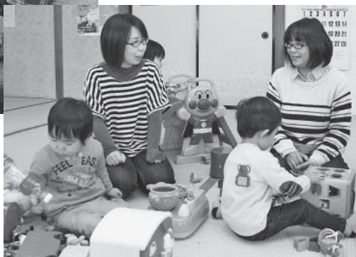
▶子どもたちが楽しく遊ぶ中、保護者同士の会話もはずむ