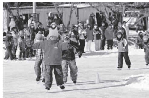
▲青葉スケートリンクまつり