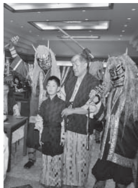
▲ホテルに現れた湯鬼神