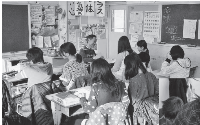
◀和やかな雰囲気の中で勉強を子どもたちも楽しみにしている