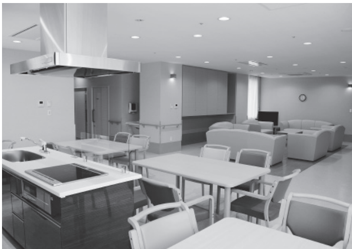
▲キッチンやソファなどが備えられた共用スペース