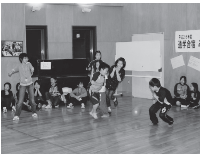
▲ドッジボールで交流を深める子どもたち