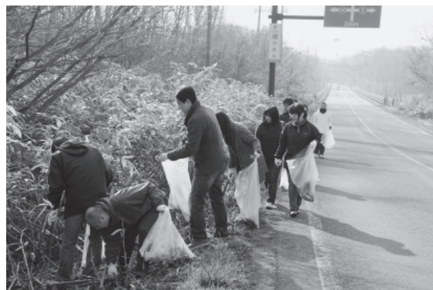
▲沿道のごみを拾うクリーン作戦の参加者