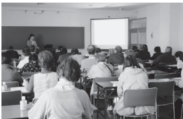
▲熱心に耳を傾ける参加者