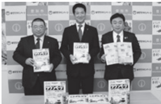
▲贈呈式で完成した合冊版を披露

市民便利帳では、市のイベントや歴史などのほか、宮城県白石市・神奈川県海老名市との『トライアングル交流』について紹介し、両市を身近に感じられる内容としています。