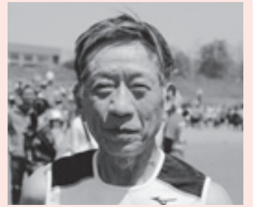
市内から10 キロ の部に参加