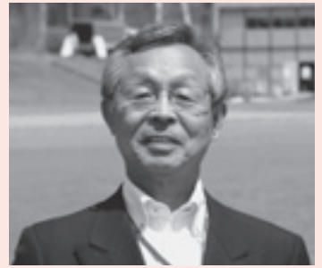
登別こいのぼりマラソン