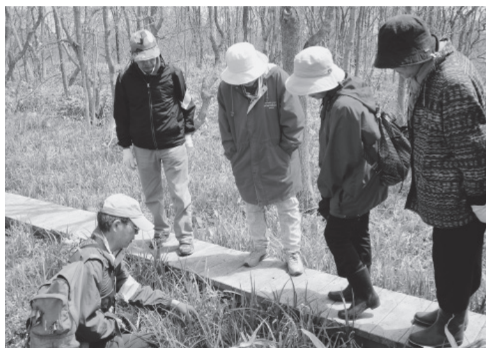
▲植物についての説明を聞く参加者