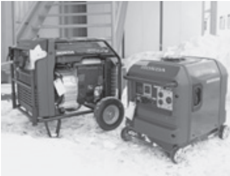
▲ガソリン発電機（上）、通信機器に接続されたバッテリー（左）、LEDランプ（右）