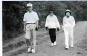
お勧めします。みんなで楽しくウォーキング

効果的な運動の目安としてウォーキングの場合では、息がはずむ程度のスピードで1日に20分以上、週に2〜3回以上行うことが必要です。