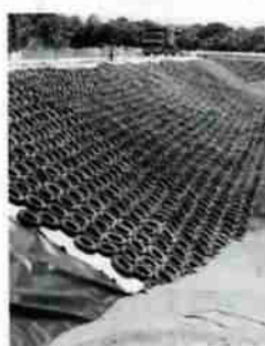
▲最終処分場で再利用されている古タイヤ

また、処分場内にたまった浸出水が地下水を汚染しないように、処分場全体に遮水シートを張り、浸出水を集め、浸出水処理施設で浄化処理をした後、排水します。最終処分場の建設資材の一部には、遮水シートを日射から保護するためのソイルセメントの定着・ひび割れなどを防ぎ、緩衝効果を考慮