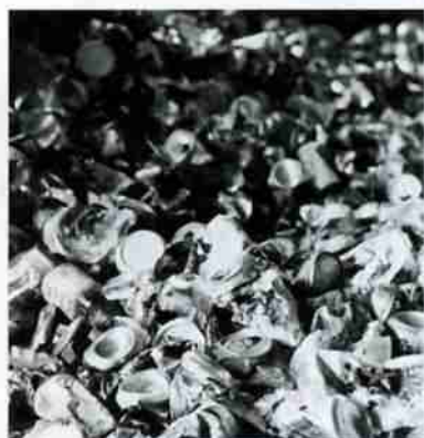
分別の徹底が求められる P3~9