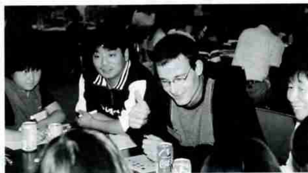
▲鬼っ子サミットで子どもたちと楽しく交流

「大学では組織運営や人事政策などを学んでいます。これはほとんど民間企業を対象にした、経営効率を向上させるためのコースでしたが、ここ数年自治体など公的組織からも注目され、受講する職員が増えてきました。公務員も民間企業の経営ノウハウを学ぶ傾向が強くなっています。デンマークでは、公的組織の給与体系が、年功序列型から能力重視型に年々変わってくるなど、組織運営の改革が進み、民間企業型に近づき始めています」と、熱心に勉強する動機やデンマークでも行政改革が進んでいることを説明し、続けて「日本では、組織を活性化させるための人事管理に関心があります