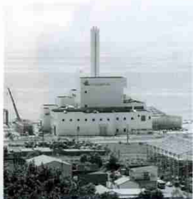
平成12年から稼働する 新ごみ処理施設 P5