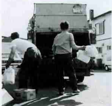
一人ひとりが排出ルールを守る P8~9

ごみ有料化の実施まで、残すところ8カ月となりました。 有料化は、排出したごみの量に応じて、各家庭にその費用の一部を負担していただくだけではなく、限りある資源を安易にごみとして排出している私たちの日常そのものを見直していかなければならないものです。 有料化実施の前に、ちょっと自宅のごみ箱をのぞいてみませんか。