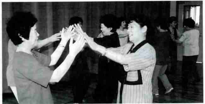
▲レクダンスで健康づくりと友達づくり (つどいサークル)