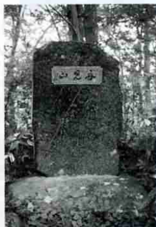
栗林加寿子の歌碑(船見山)