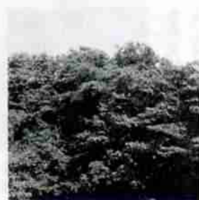
▲失うのは簡単でも、元に戻すことが困難な美しい自然

ごみを減らし、分別を徹底する。リサイクルや再利用を考える。一人ひとりが身近なところから始めることで、私たちは豊かな未来を築いていけるのではないのでしょうか。