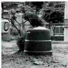
▲コンポスト容器の利用で生ごみを減らすことができて