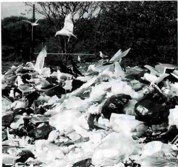
▲資源の浪費ともいえる大量のごみ。重要な資源として、これらのごみは有効に活用されたのだろうか

生産と消費は、私たち人間が生きていくために絶つことのできないサイクルではありますが、現代社会ではこのサイクルが、どんどん短縮しているのではないのでしょうか。節約こそ美德という概念が希薄となり、浪費ともいえる使い捨て感覚が私たちの心に蔓延しています。 またまだ使える新品同然のものをごみステーションに捨て、飽くことのない購買心を満たすのは個人の自由ですが、資源の有効利用や環境問題などを一人ひとりが考えなければならぬ現代では、購入時だけではなく、廃棄するときにも個人の責任が求められます。