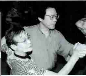
◀▲レッスンの成果を披露できるダンスパーティーは人気行事です。