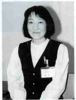
今月のアドバイザー