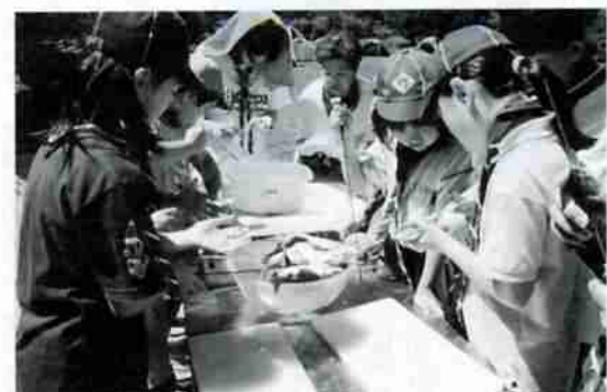
▲習得した技能が活かされるキャンプ

「子どもたちには、ナイフの使い方や火の起こし方、けがをしたときの救急法など、いろいろなことを教えていますが、ボーイスカウト活動の最大の目的は、一人ひとりの子どもが活動を通じて、どんなときでも他の人の役に立つこと。私たち指導者は、さまざまな技能の習得や体験、遊びを通して、人と自然を思いやる