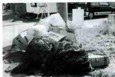
▲各家庭から排出されるごみはわずかでも、まち全体では膨大な量になる