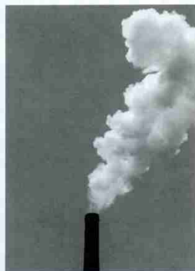
ダイオキシン対策 P5

ごみ有料化の実施まで、残すところ8カ月となりました。 有料化は、排出したごみの量に応じて、各家庭にその費用の一部を負担していただくだけではなく、限りある資源を安易にごみとして排出している私たちの日常そのものを見直していかなければならないものです。 有料化実施の前に、ちょっと自宅のごみ箱をのぞいてみませんか。