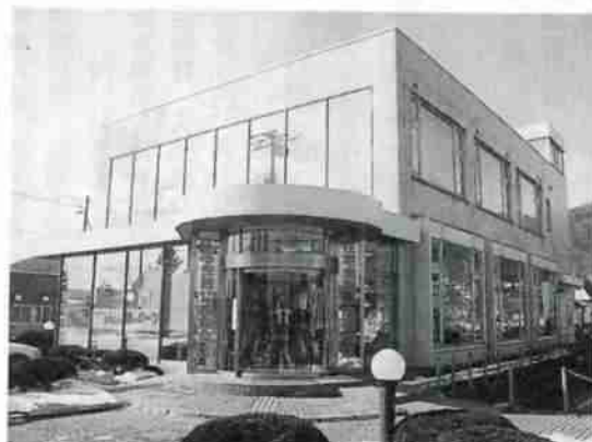
▲室蘭信用金庫若草支店