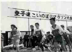
◀昨年の大会の様子