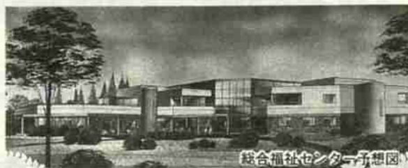
総合福祉センター(予定)