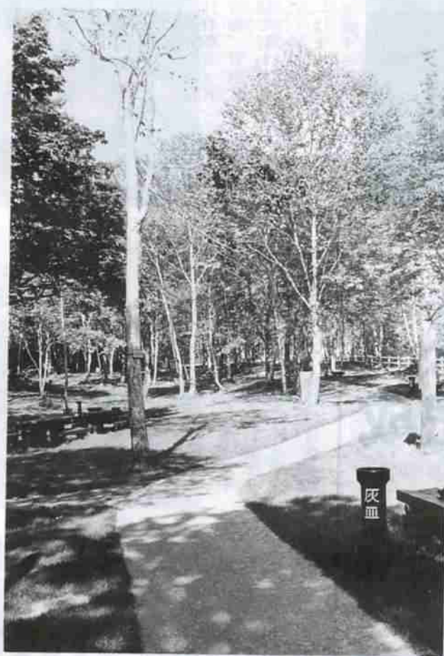
—ナナカマドの広場—

また、市ではヘルスパイオニアタウン事業の一環として、市内3箇所に自然散策コースを作りました。まだ残されている郷土の歴史と自然にふれられるコースです。コースのルート、内容はそれぞれ、鷺別支所前、登別支所前、川上公園に看板がありますのでご利用ください。