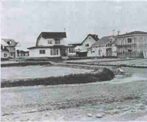
▶新しい住宅も建ちはじめた同地区