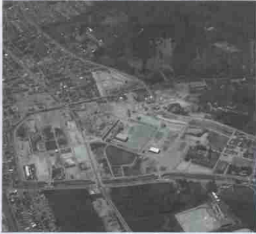
▶工事の進む富岸地区

保留地は、区画整理事業により良好な宅地として造成されていますのでお買得な土地となっています。お申し込み・問合せは、都市計画課区画整理事務係まで(TEL 2111内線278)