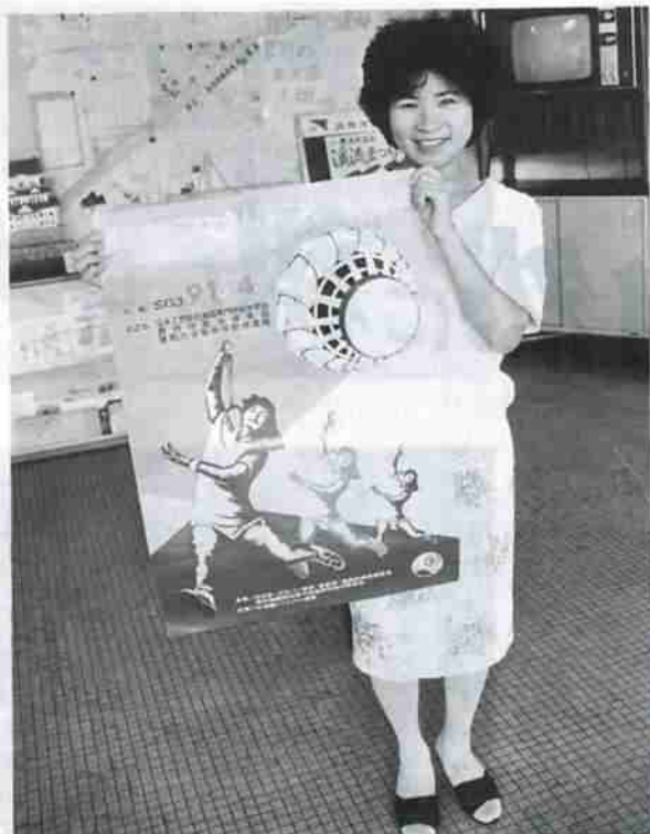
(完成したポスター)

また、今大会は、来年開催さ れる「はまなす国体」をスムー ズに運営するためのリハーサル