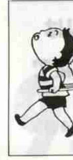
※上記以外の地区は別途支給します。