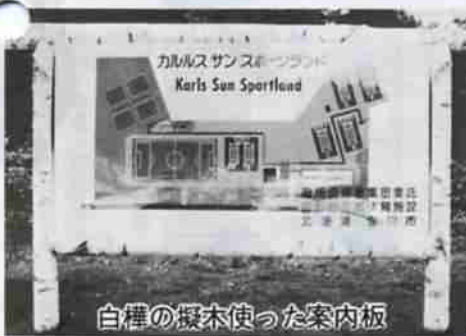
白樺の樺木を使った案内板