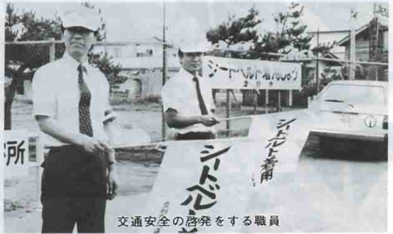
交通安全の啓発をする職員

公聴広報課は、市民の交通安全、公害防災に関すること、広報の作成など皆さんに直接関係のある仕事を担当しています。今回は、交通安全係を紹介します。職場は二階です。主な仕事は、交通安全思想の普及のための各種交通安全教室、各期交通安全運動、市民交通傷害保険事務などです。また、市交通安全協会事務局の仕事もこの係の担当です。その中でも、今年力を入れているのが「参加する交通安全運動」の定着です。同職員にたずねたところ、「今までのように特定の人が増加する運動ではなく、多くの市民の皆さんが参加する運動でなければ意味がありません。」と言葉が返ってきました。