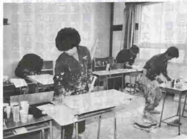
塗装の実習訓練に励む訓練生

訓練内容は、手編みの専門学習と実技で、編み物についての専門知識と技能の応用を修得します。受講されている方は、三十代前半の女性十人で、修業年限は一年間です。この二科が新設されたことにより、手狭になった現在の実習室が大幅に増築されます。現校舎の山側に鉄骨平屋建てで三百八十二平方メートルを建て、新しい実習室を各科の訓練に使う一方で、現在の実習室を電子計算機科で使うものです。同校は現在、七科で六十三名の方々が訓練に励んでいます。優秀な技能を修得するため、また新しい技術革新に対応できる人材を目指して、皆さんも同校を活用してはどうか。