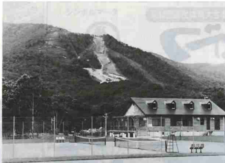
北欧の山小屋を思わせるセンターハウス

「カールス・サン・スポーツランド」は、カールス温泉に近い旧カールス小学校跡地周辺約三万平方メートルで、登別温泉から車で十分足らずのところに位置しています。中央にカラ松材を使った山小屋風のセンターハウスが建ち、事務室のほか食堂、研修室、更衣室、トイレなどが設けられています。センターハウスの正面は約五十台収容の駐車場になっています。その奥に、白樺の林に囲まれた全天候透水性のテニスコート四面があずま屋と