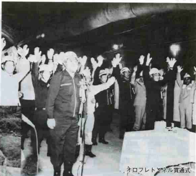
オロフレトンネル貫通式

オロフレトンネル・困難な工事も「全面連続防水シート工法」という全国的にも例の少ないハイレベルな工法で乗り越え丸4年で貫通、63年春には開通します。