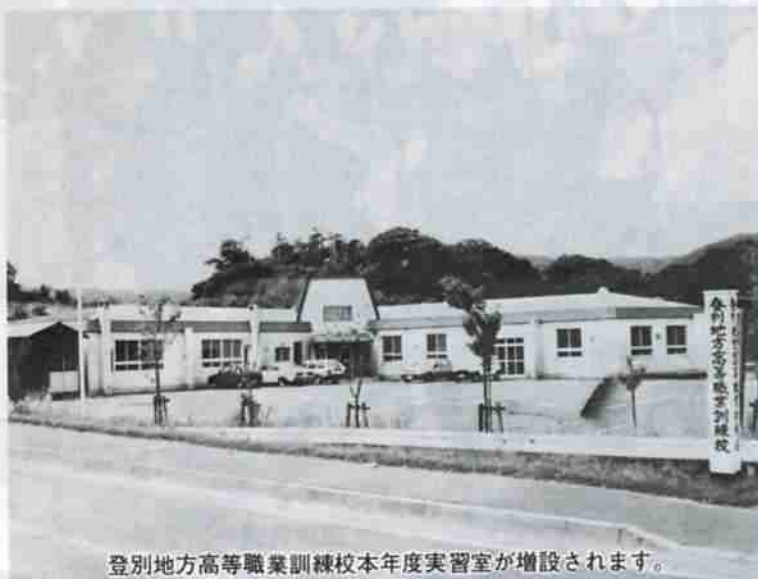
登別地方高等職業訓練校本年度実習室が増設されます。

青葉町の登別市職業訓練センターにある登別地方職業訓練校に、本年度から電子計算機科と編み物科が新設され、訓練科目が一段と豊富になるとともに、訓練内容も一層充実されました。校舎も大幅に増築されることになっており、ゆつたりとした校舎で技能の修得ができることになりました。市ではこれを機会に、勤労者の技能の修得と資質の向上を図って雇用の促進にも努めていきます。