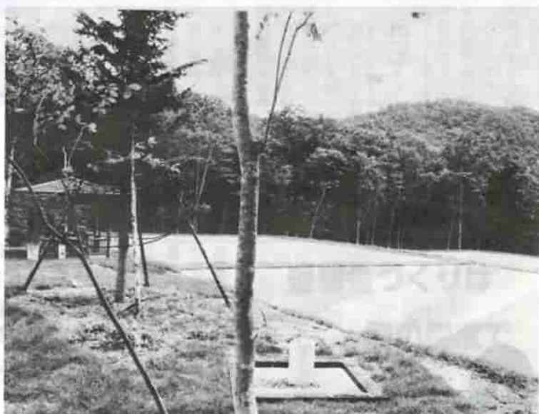
林に囲まれ、芝生で区切られた4面のゲートボールコート

また、同グラウンドの奥には、一段下って芝生で区切られたゲートボールコートがカラマツ材のあずま屋とともに整備されています。施設全体が豊かな自然と調和し、多目的広場からセンターハウス方向の眺めは、米馬岳やオロフレ山をバックに北欧の山小屋を思わせるたえずまいとなっています。