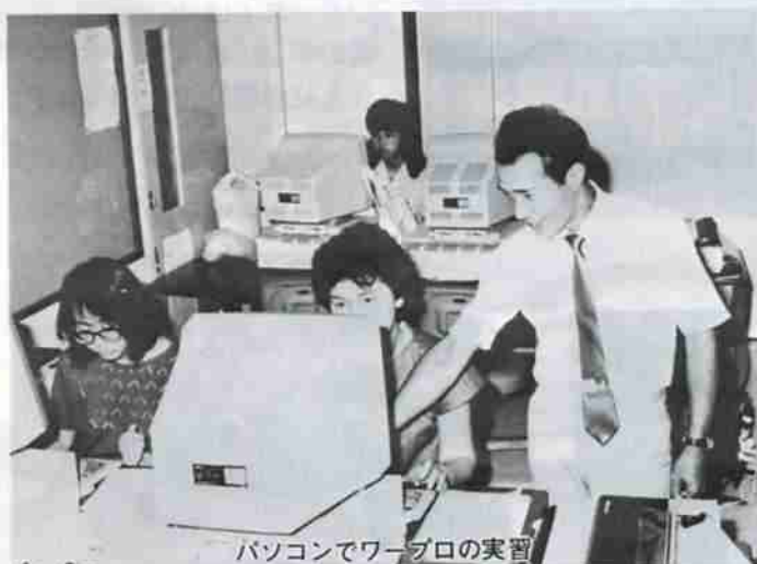
パソコンでワープロの実習