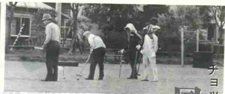
チヨット気になりませんか