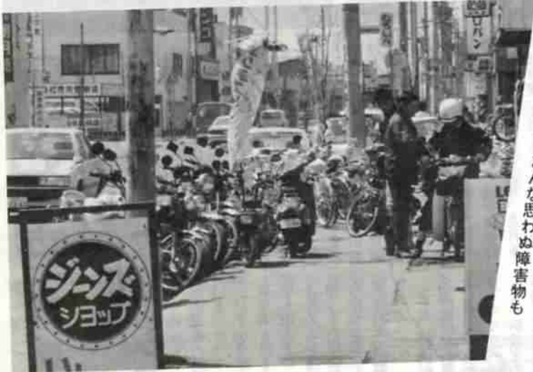
◀ 道路には、こんな思わぬ障害物も

という会話が聞こえ、忙しい一日が始まっています。一歩、治療室に入ると中は、厳しさと責任のある仕事場。そこには、障害者や健康者の区別はありません。永年の の人達との会話には、笑顔がこぼれています。五時、診療が終わり中川さんが楽しみに散歩の時間。「人間は、歩くことが基本。ですから、朝晩かならず愛犬