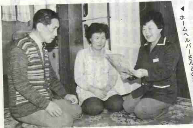
◀ ホームヘルパーさんとの語らい