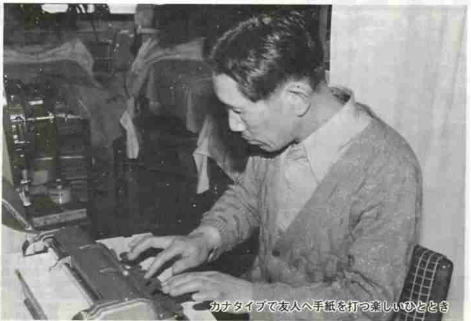
カナタイプで友人へ手紙を打つ楽しいひととき

夜の八時過ぎ、点字、カタカナのタイプで友人へ手紙。昨年結成した視力障害者協会の会報づくりに手を動かしていました。