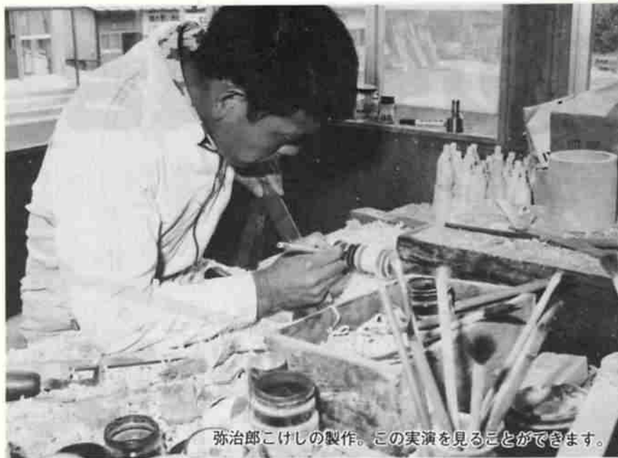
弥治郎こけしの製作。この実演を見ることが出来ます。

記念式典は、午前十時から 旗の交換や花束の交換が行われ、関係者約六百名が参加して行われた後、両市長のあいさつ、両市議会議長の祝辞などが予