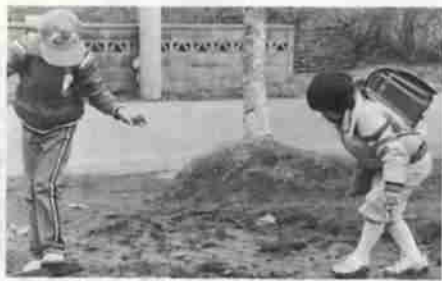
このコーナーに皆さんの写真をお寄せください