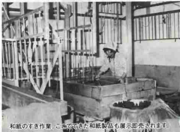
和紙のすき作業。ここでできた和紙製品も展示即売されます。

奉仕と宣伝」をモットーに、新鮮さ、豊富さ、珍しさをテーマとして開催されます。白石市からは白石和紙、こけし、木地玩具、木製品、温麺、地酒、笹かまぼこ、みそ、しょうゆなどが出展、即売されます。登別市からは、地元製造製品や農水加工物、観光工芸品、民芸品などを出展即売することになっています。