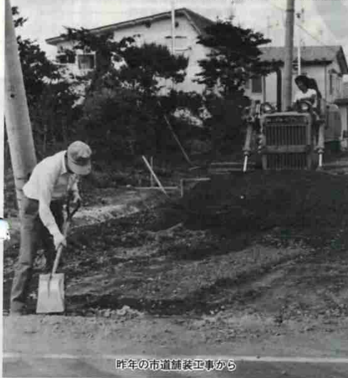
昨年の市道舗装工事から

本年度の事業予算、約十三億円のうち工事関係の予算は約二十五億六千七百万円です。市では、今後も事業の緊急性を考慮しながら、地域経済振興を最重点に、年間を通して計画的に発注していく予定です。