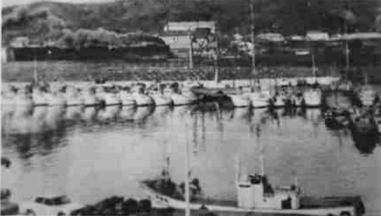
S・Lが走っていた当時の港町