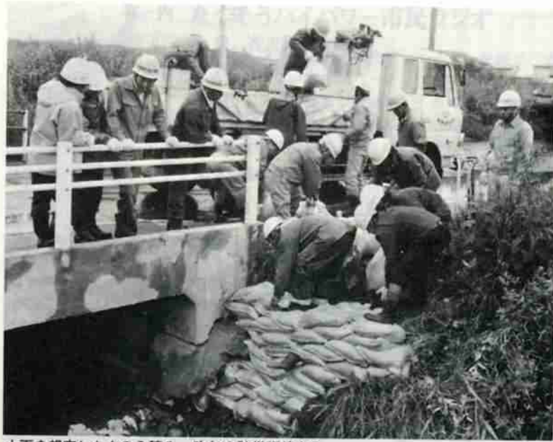
大雨を想定した土のう積み、昨年の防災訓練から。