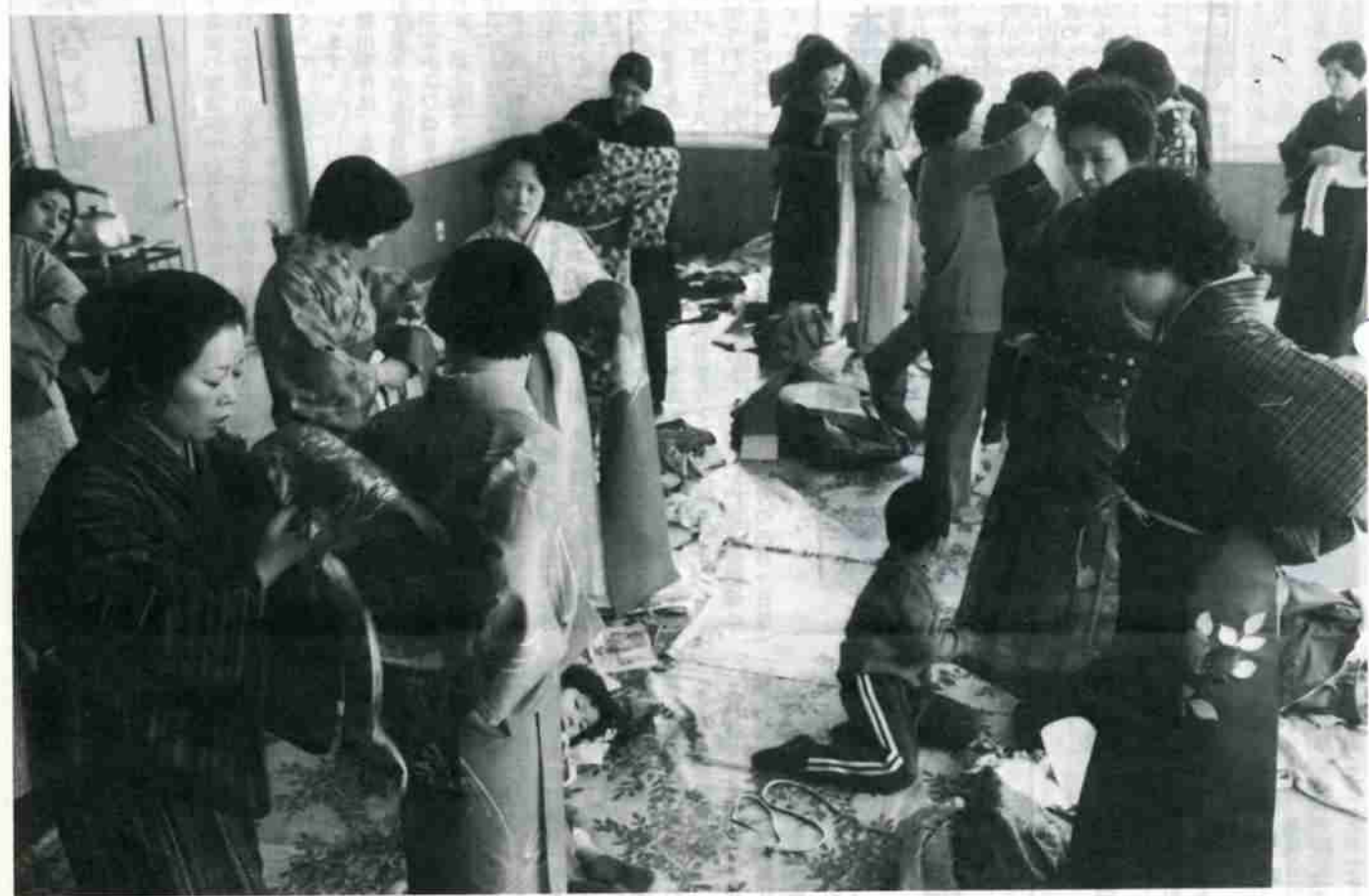
主婦らに人気のある着付け教室

○No. 298 ○昭和55年3月15日発行 ○編集発行/北海道登別市/総務部公聴広報課 ○印刷/中西印刷