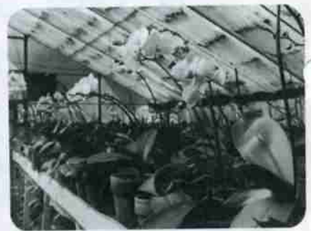
春の訪ずれを思わせる胡蝶蘭 中登別洋蘭園にて

登録料 一頭 二千円 注射料 一頭 千五百円 応診による注射の場合は、別に登録料が千円必要です。 ※登録および予防注射をしないで人畜に危害を加えた犬は、殺処分になることがありますので、必ず受けてください。 犬についての問い合わせは、市役所環境衛生課(電話5局2958)へご連絡ください。