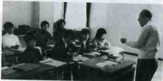
徳島校長の指導を受ける生徒たち

しかし、この教室も三月二十八日の授業を最後に終わることとなりましたが、卒業する十一人の生徒たちは徳島校長の暖かい思いやりや、数々の思い出を胸に刻み、四月からそれぞれ、小学校へ社会へと出発することになりました。