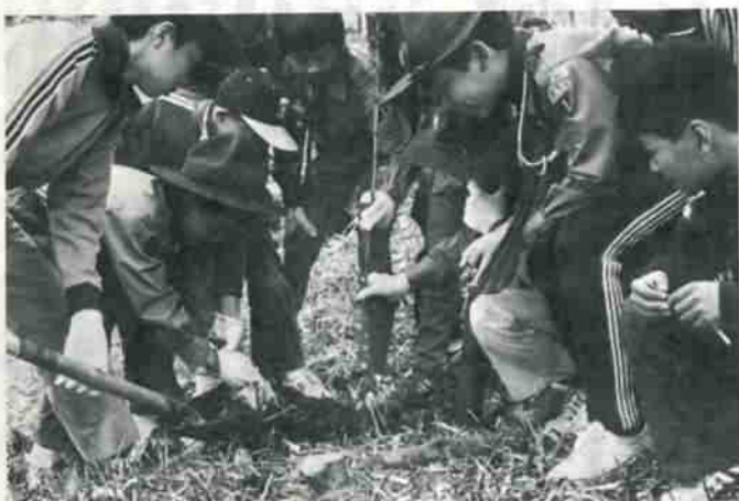
ボーイスカウトも一生懸命に植樹に協力しました

登別市民憲章推進協議会と市の共催による「第六回市民植樹祭」が、五月二十七日午前十時から市内柏木町の市民の森、望洋公園で行われ、グリーンパトロール隊員や青年会議所、登青連、家族連れなどが約二百五十人参加、サクラランボやウメ、クリの三種類の合計二百本の植樹作業にさわやかな汗を流しました。