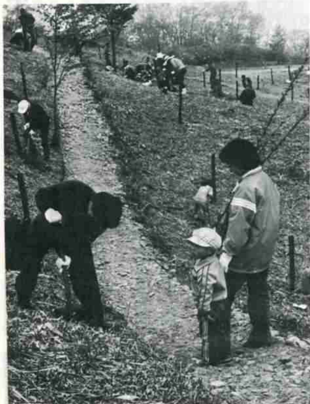
家族連れが市民が大ぜい植樹に参加さわやかな一日