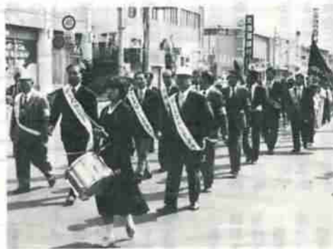
前日の参加を呼びかける市中パレード

前日はグリーンパトロール隊員の入隊式が行われ、参加を呼びかける市中パレードでは、道行く人に花のタネを配って気分を盛りあげていました。 登別市民憲章推進協議会と市の共催による「第六回市民植樹祭」が、五月二十七日午前十時から市内柏木町の市民の森、望洋公園で行われ、グリーンパトロール隊員や青年会議所、登青連、家族連れなどが約二百五十人参加、サクラランボやウメ、クリの三種類の合計二百本の植樹作業にさわやかな汗を流しました。