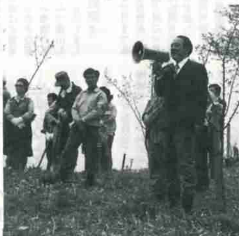
参加した市民に労をねぎらう中浜市長