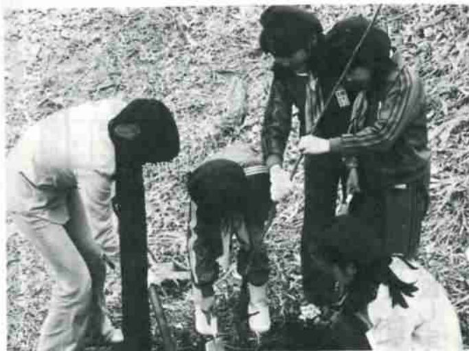
グリーンパトロール隊員が全員参加して楽しい植樹でした