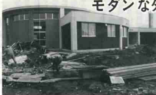
工事中の栄町保育所 3月29日撮影

昨年秋から建設を進めていた、市内で九番目の市立保育所が完成し、四月三日に開所式を行いました。 栄町保育所は、栄町二丁目の旧富士建設跡地に建設したもので、外観はこれまでの保育所のイメージとは、がらりと様子を变えた、半円形の遊戯場や、カラー化された保育室には、子供たちに親しみやすく色分けした教材入れや、雨具かけが用意されています。 総工事費は、九千三百三十万円で、補強コンクリートブロック建平家で延面積は約八百平方メートル。 収容数は、百二十名で、川上、鷲別、富士に次いで三歳未満児も収容し、職員数は保母十二名など合計十六名となっています。