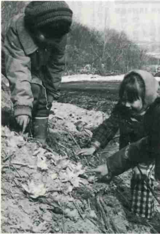
陽光に花開くフキのとう——

○No. 277 ○昭和54年4月15日発行 ○編集発行/北海道登別市/総務部公聴広報課 ○印刷/中西印刷