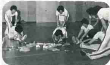
＝ママさんバドミントンサークル＝

和気あいあい、楽しく汗を流しています——サークルに入っている方は現在26人で、ほとんどの方は体育館に来て初めてラケットを握ったという方ばかりです。年齢は28歳から41歳と幅がありますが、35歳前後の方が多そうです。火・金曜日の週2回練習をしています。この日がくるのがたのしみで、体育館に行く時間がくると、家事もそこそこ出て来ます。