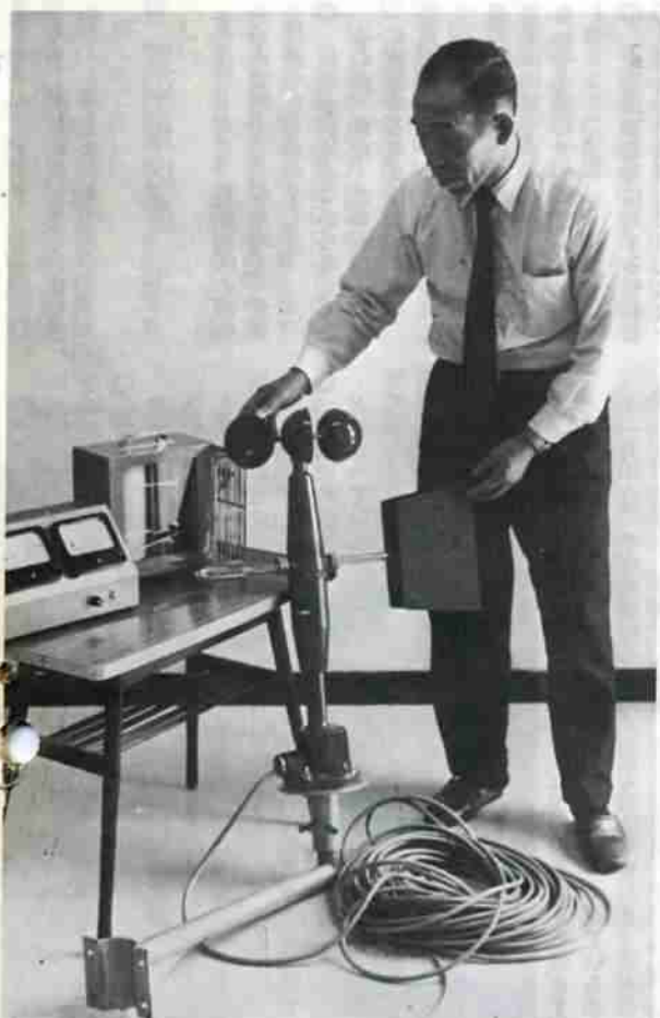
火災などの災害の未然防止に役立てようと寄贈された風向風力計と温湿度計

わたしたちの「まち」から、火災や自然災害をなくし、安心して暮らすためには、こうした災害を未然に防止することを考え、そのための対策をたてなければなりません。 この対策には、市民が各家庭毎に考えるもの、市役所や道など地方自治体の行なうもの、国の実施するものと分かれていますが、それぞれが対策に万全を期することが大切です。