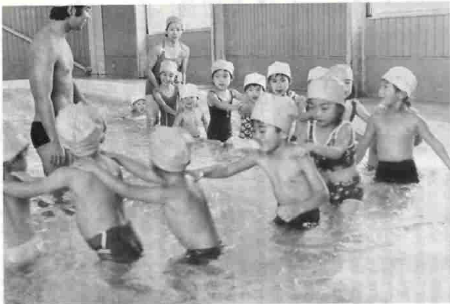
幼児水泳教室で水なれ遊びに歓声をあげる市民プールのこどもたち

市民プールでは、開館一周年を記念し、二月二十八・二十九日を無料開放します。 両日は、宝さがし、親子リレーなどの催し物を計画していますので、多数の方のご利用をお待ちし