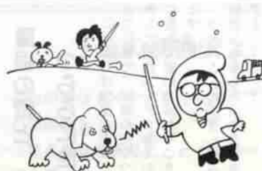
犬の放し飼いはやめましょう

お年玉つき年賀 ハガキの当選番号 お年玉つき年賀ハガキの当選番号は次のとおりです。 賞品は、なるべく早く、最寄りの郵便局でお受け取りください。 なお、当選された年賀ハガキは番号部分を切り離さず、そのまま持参ください。また、二等以上の賞品をお受け取りの場合は、印鑑を持参ください。 一等 折りたたみ式自転車