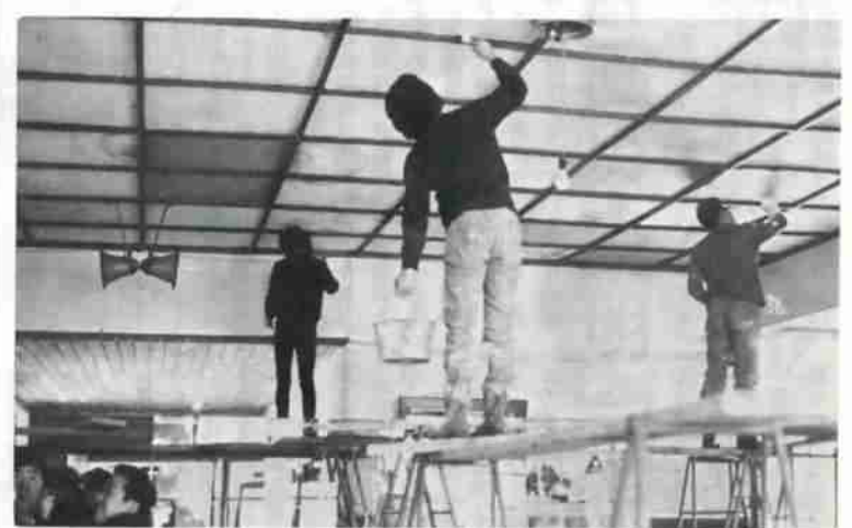
西小学校で行なわれた技能協会会員による校舎修理などの労力奉仕作業

昭和二十七年に建てられた、西小学校は古い木造建築のため、各所いたんでいたので、今回の労力奉仕で校長先生をはじめ、先生方、教育委員会では、大変感謝していました。