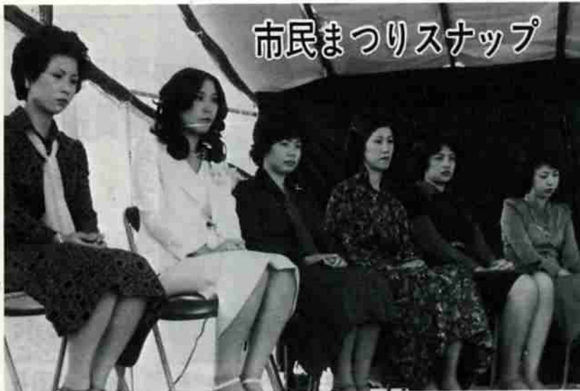
準ミス登別8人の中から次の方々をミス登別に選ばれました。