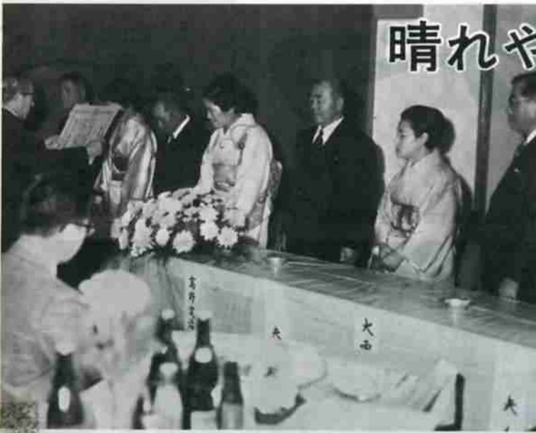
田村市長から表彰状・記念品を受ける市功労者の方々