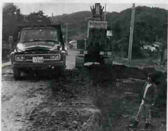
石山通り 現在、工事についてお気付の点がありましたが、市土木部都市建設課までお問い合わせください。

石山通りの舗装はじまる 都市計画街路の石山通り(登別地区)は、昭和四十八年度から昭和五十年年度までの三カ年計画によって、舗装工事を行なってきたが、最終年の今年度でいよいよ完成することになりました。 この石山通り(市道名「紀文路」)の沿線は、最近急激に住宅等による開発が進んだことに伴い交通量が増加してきています。こうしたことを考えて、市は歩道と車道を分離し、地域のな