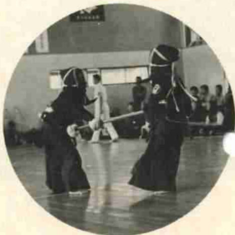
登別青年会議所の青少年柔剣道練成大会