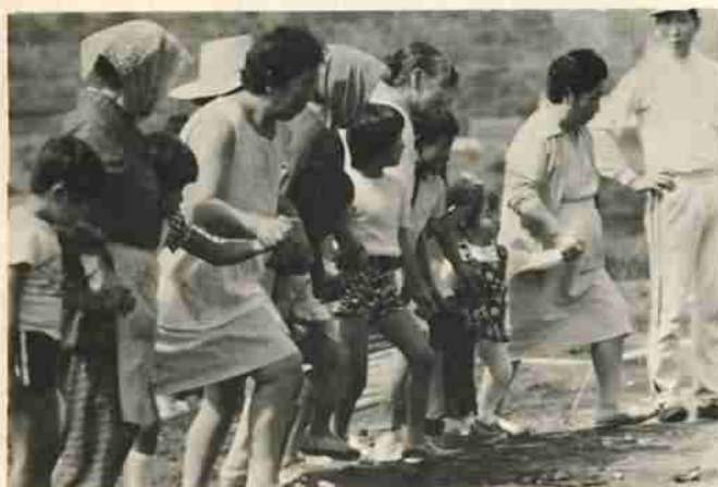
幼児からお年寄りまで参加した富浜町内会の運動会。

秋晴れの九月九日(日)、市内各地区では、スポーツの秋の華開けにふさわしく盛りたくさんの行事が繰り広げられました。秋晴れの日を歩こうと教育委員会がミニクロスカントリーを開催、観覧ダムコースを約三百人の子供たちが参加し、自然の中、さわやかな空気を胸いっぱい吸い込んで楽しんでいました。また、同じ日町民運動会、レクリエーション大会、スポーツ大会などが各地で開かれて、日頃のストレスを解消し、実力を競いあっていました。