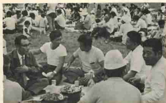
登別技能協会のレクリエーション大会風景

秋晴れの九月九日(日)、市内各地区では、スポーツの秋の華開けにふさわしく盛りたくさんの行事が繰り広げられました。秋晴れの日を歩こうと教育委員会がミニクロスカントリーを開催、観覧ダムコースを約三百人の子供たちが参加し、自然の中、さわやかな空気を胸いっぱい吸い込んで楽しんでいました。また、同じ日町民運動会、レクリエーション大会、スポーツ大会などが各地で開かれて、日頃のストレスを解消し、実力を競いあっていました。