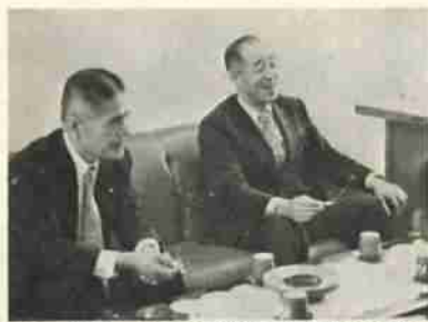
ロータリークラブが図書購入費を寄贈