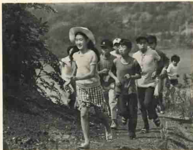
ミニクロスカントリーで秋晴れの日を楽しむ子供たち