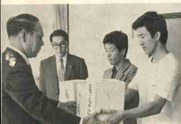
お年寄りのためにと募金箱を渡す公明党青年局員

登別支部青年局では、この敬老募金は初めてのことでしたが今後も続けたいと話していました。