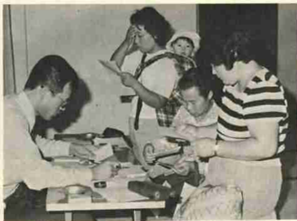
乳幼児医療無料の申請は早めに行いましょう。

前進したものであります。市内で対象となる三歳未満児は約二千六百人います。赤ちゃんがすこやかに育つことは、私たちの願いです。そのために、まだ受給者証をいただいていない方は、早く申請して、この制度をご利用くださるようお願いいたします。