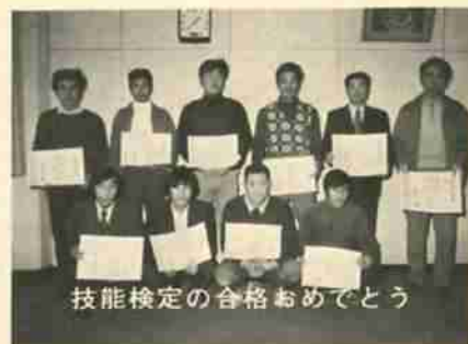
技能検定の合格おめでとう

今後、市税務課より申告書用紙等の書類をみなさまの所にお届けしますが、計算方法、記入要領などの疑問な点がありましたら税務課市税係(電話登別5-2111)へお問い合わせください。