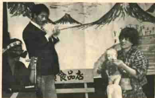
青年ボランティア連盟の寸劇