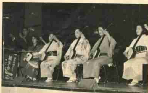
登別市民連合会の三味線曲引