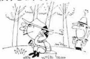
タバコやたき火の仕末は完全に

る場合は、消防署の許可をもらうその許可条件を厳守してください。とくに、気象条件が悪く、風が強いときなど、危険と思われるときは、火入れを中止してください。▽火入れを行なったときは、そのあと始末を完全にし、再燃のおそれがないか、必ず確認をしてください。