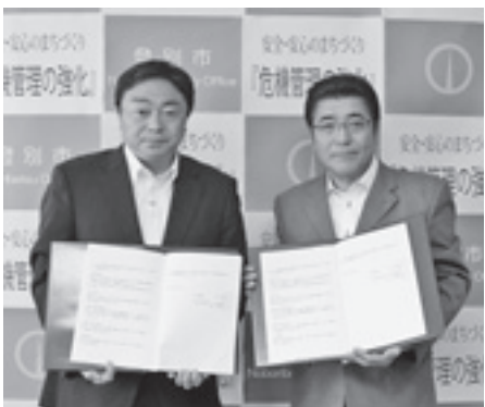
▲(株)共成レンテム登別営業所との協定締結式