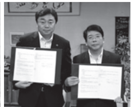
▲(株)サッポロドラッグストアとの協定締結式