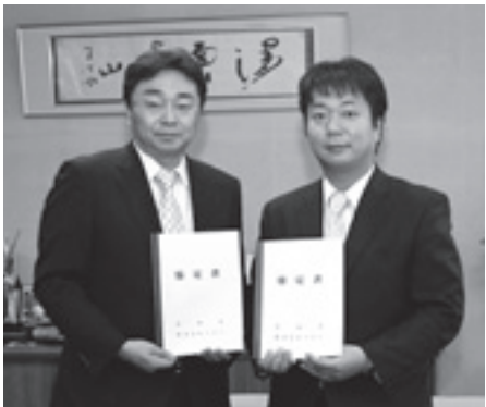
▲(株)ツルハとの協定締結式