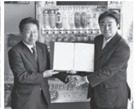
▲サントリーフーズ(株)との協定締結式