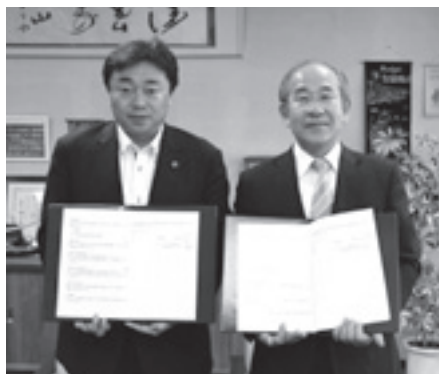
▲マックスバリュ北海道(株)との協定締結式